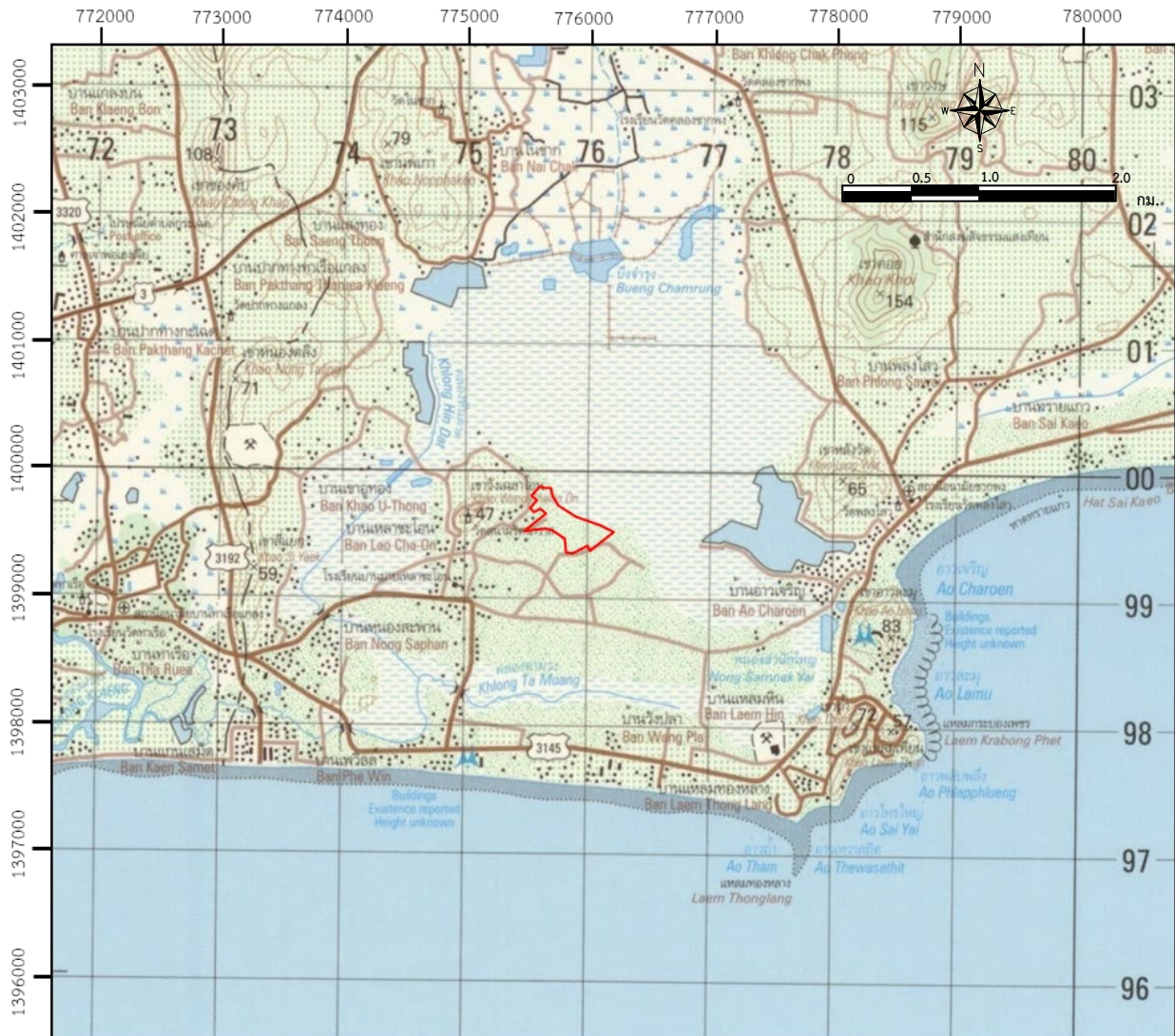
รูปที่ 1-1 แสดงตำแหน่งที่ตั้งพื้นที่โครงการ