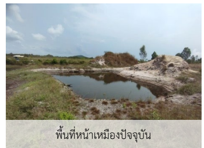
พื้นที่หน้าเหมืองปัจจุบัน