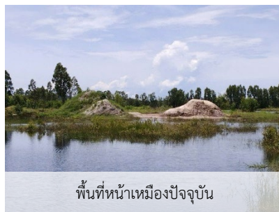
พื้นที่หน้าเหมืองปัจจุบัน