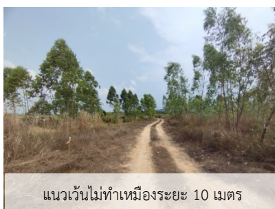
แนวเวนไม่ทำเหมืองระยะ 10 เมตร