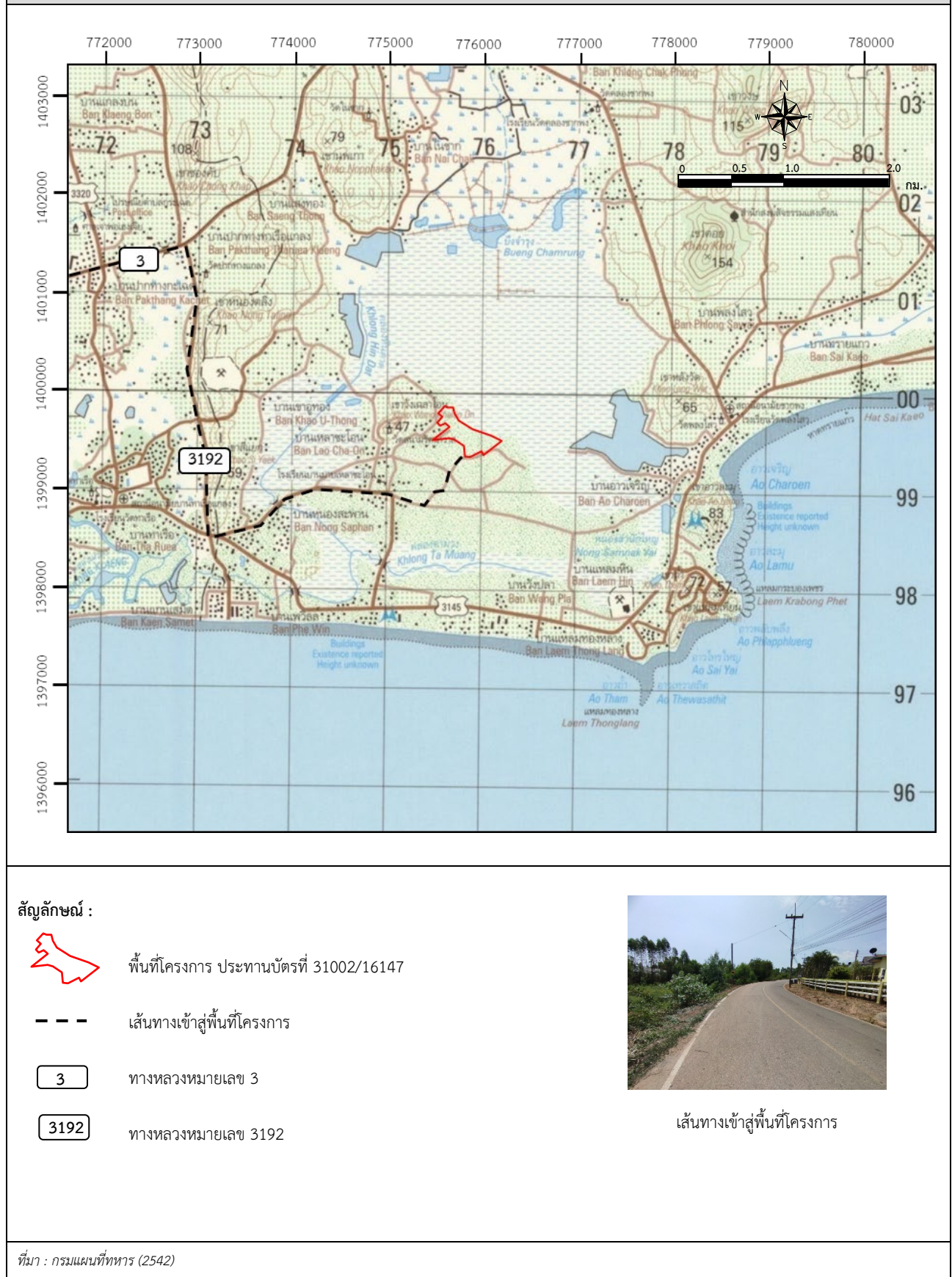
รูปที่ 1-3 แสดงเส้นทางคมนาคมเข้าสู่พื้นที่โครงการ